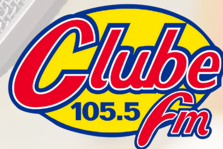
TABELA DE PREÇOS 2026